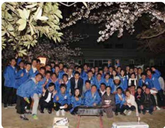
▲4月に行われる花見例会