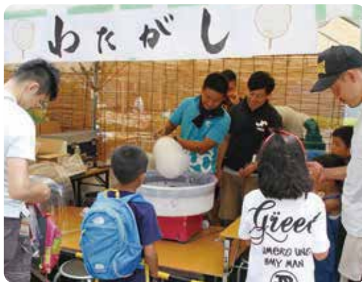
▲安城七夕まつりへの参画