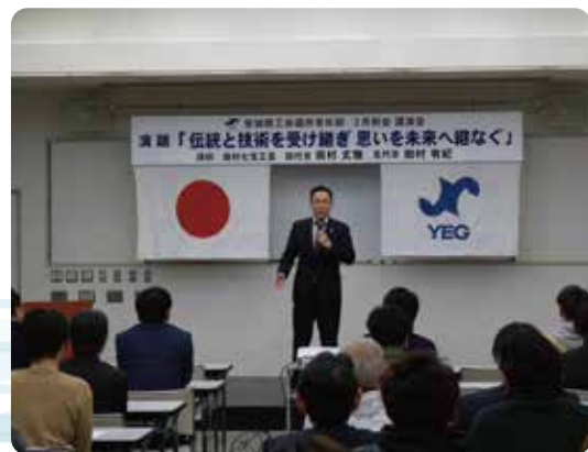
▲講師を呼んでの講演例会