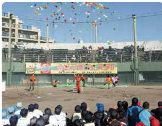
▲安城元気フェスタの運営