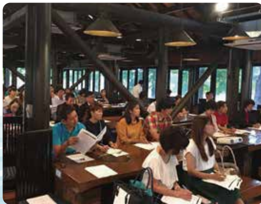
▲家族参加型の講演例会