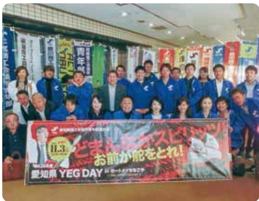
▲愛知県 YEG DAY